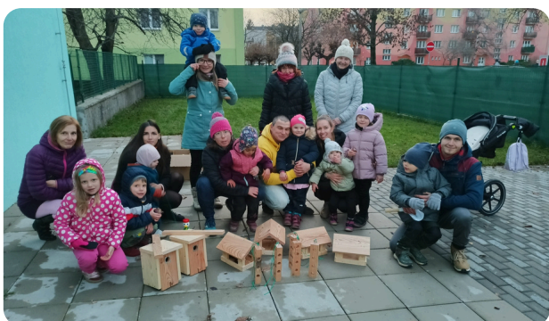
Barevná zahrada snů