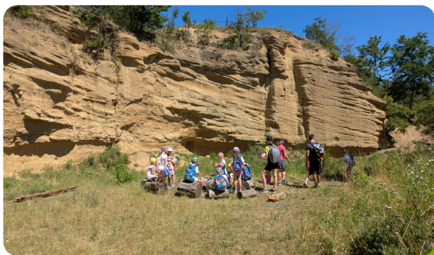
Kreativní cesta do pravěku