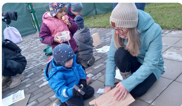
Barevná zahrada snů