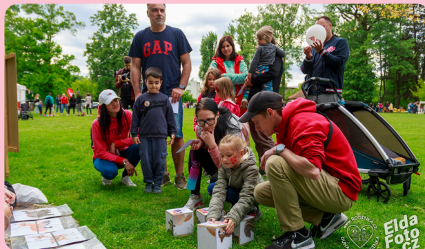
Míle pro mámu