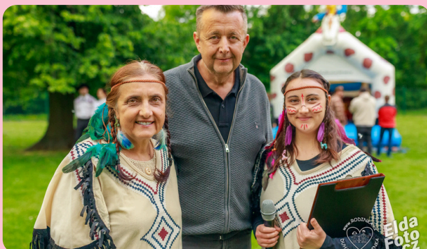
Míle pro mámu