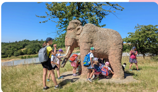
Kreativní cesta do pravěku